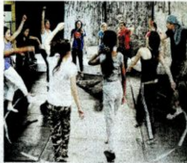
À raison de 8 périodes par semaine, les 25 élèves inscrits au projet ont travaillé d'arrache-pied pour présenter un spectacle de promotions qui donne la route.

Ce projet a su faire dialoguer des élèves entre eux, à valoriser leurs talents en leur apportant éga-